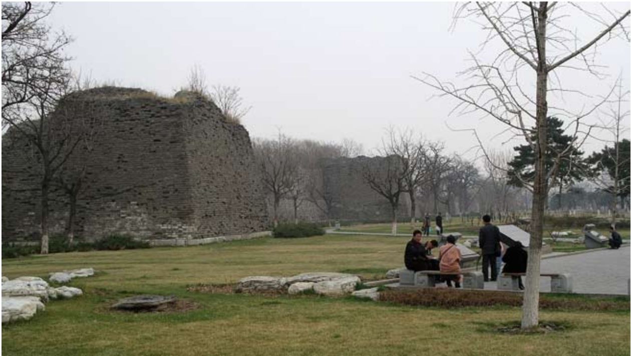
På 1950- och 1960-talet revs Pekings stadsmur. Ett kortare fragment av muren har sedan 2002 synliggjorts och en park har anlagts framför den.

dödsskjutningarna omtalats som massakrer kan man inte invända mot. Däremot mot den tystnad som omger den största massakern på demonstranter i Kinas 1900-talshistoria, den som kommunistpartiet utförde på åtminstone åtskilliga hundra personer i Peking 1989 och som är okänd för en del ungdomar i dagens Kina.