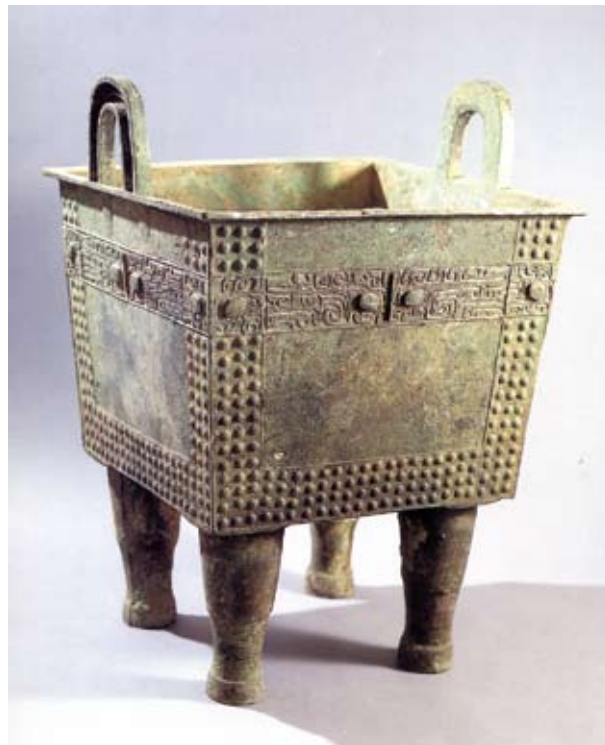
Bronsföremål, en fyrkantig ding, från Erligang.

Erlitou förefaller vara en direkt föregångare till Erligang, som påträffades 1952–53 i den moderna staden Zhengzhou. Erligang, som dateras till perioden 1600–1400 f.Kr. kallas i The Cambridge History of Ancient China för ”den första stora civilisationen i Östasien”. Här fanns en stadsmur närmare sju km lång, palats och andra stora byggnader och ett välstånd som vida överträffade Erlitous.