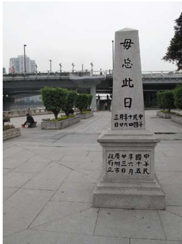
Monument vid Pärlfloden i Kanton över offren för massakern den 23 juni 1925 då trupper från den utländska koncessionen intill öppnade eld och dödade minst 50 personer. Texten lyder: ”Glöm inte denna dag”.

Men ser vi till historien så är kopplingen mellan fred och