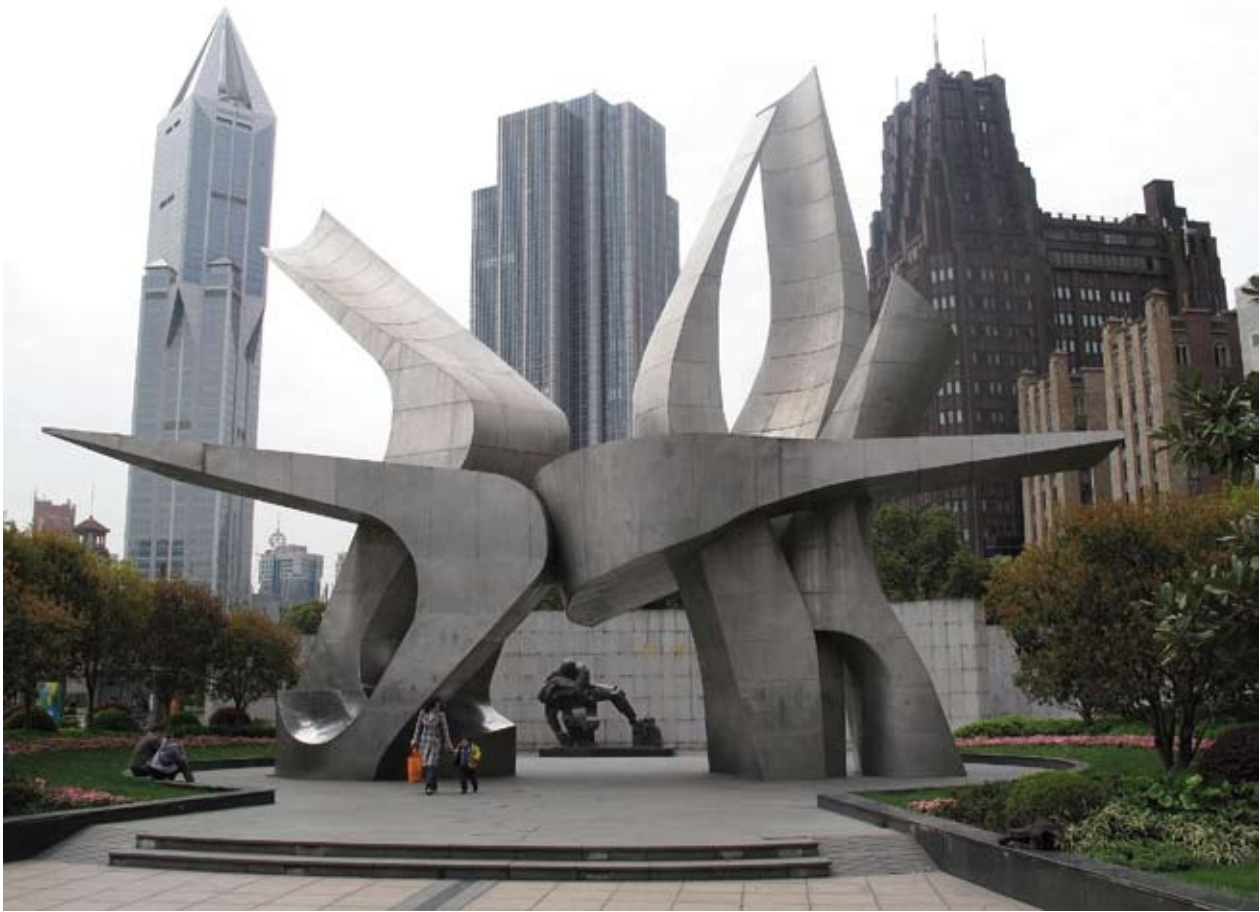
Monument över 30-maj-rörelsen 1925 vid Folkets park i Shanghai. Det är osäkert exakt hur många som dödades då polisen i den Internationella koncessionen öppnade eld mot demonstranter men det rör sig förmodligen om minst nio personer.

borde tillhöra Kina. Framst handlar det om Taiwan, men man kan inte utesluta att ett militärt starkt Kina i framtiden kan göra anspråk på andra områden också. Taiwan var införlivat med Qingväldet 1683–1895, men har, med undantag för tiden 1945–49, inte varit underställd en regering på det kinesiska fastlandet på över hundra år. Taiwan styrs förvisso av kineser, men är det självklart att alla kineser ska tillhöra en och samma nation?