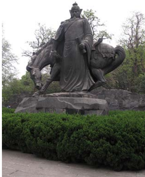
Staty av Songgeneralen Yue Fei vid Gula tranans paviljong i Wuban. Han bekämpade jürchen, som kontrollerade norra Kina, men Songkejsaren kallade honom tillbaka till huvudstaden i söder, där han senare avrättades.

Trots att det nu är över sextio år sedan kommunistpartiet ”befriade” kineserna, påminns dessa ofta om det förflutna: ”glöm inte de nationella förödmjukelserna!”. Efter massakern vid Himmelska fridens torg i Peking 1989, som ledde till en stark kritik av Kina i västerlandet, har budskapet intensifierats.