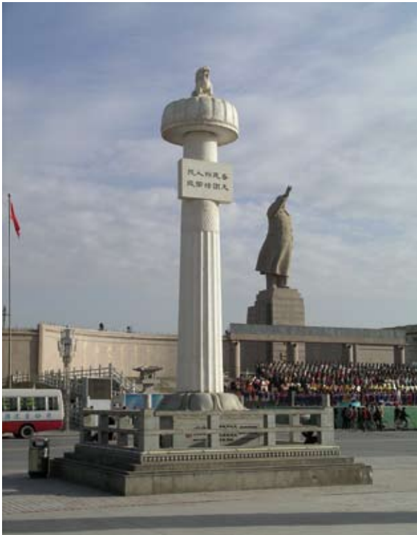
På torget i Kashgar i Xinjiang demonstreras det tydligt vem som har makten över detta som kallas för uigurernas autonoma område, och som omfattar en sjättedel av Kinas yta. I bakgrunden syns den kinesiska flaggan och en jättestatya av Mao. I förgrunden en pelare av den typ som uppfördes vid gravar från 400–500-talet och som man fortfarande kan finna på landsbygden utanför den gamla huvudstaden Nanjing. Inskriptionen lyder: "Länge leve den stora enigheten mellan de olika etniska gruppernas folk."