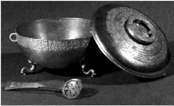
I en grav från 400-talet f.Kr. som tillhörde Markis Yi av Zeng påträffades man 1978 bl.a. denna guldskål med lock och tillhörande sked. Skålen är 15,1 cm i diameter, 10,7 cm hög och väger 2,15 kg.

Bland något yngre fynd märks de från senare Shangdynastin (ca 1600–ca 1040 f.Kr.) som påträffades 1986 i Sanxingdui i Sichuan tillsammans med ett stort antal bronsföremål – bronser som skiljer sig markant från dem som tillverkades i kärnområdet kring Gula floden. Vissa av de märkliga huvudena i brons har masker av guld, men man påträffade också en 142 cm lång kapp klädd med guldfolie. Guld har gärna kombinerats med andra material i dessa tidiga fynd och tekniskt och formmässigt märks en påverkan från bronserna.