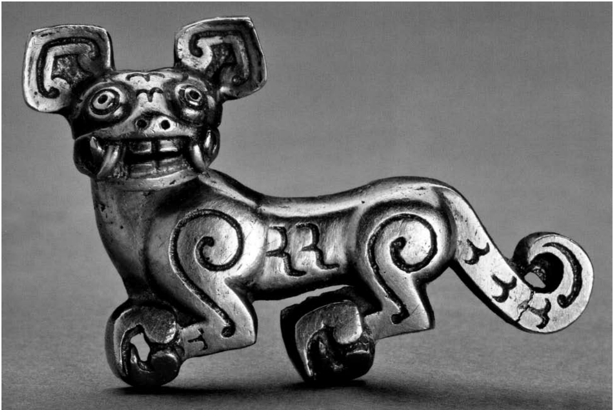
Guldtiger från 400–200-talet f.Kr. som påträffades i Baoji. Tigern är 4,5 cm lång