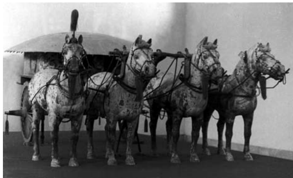
Ett av de två bronshästekipage som påträffades i ett schakt 20 m från Förste Qinkejsarens gravhög 1980.