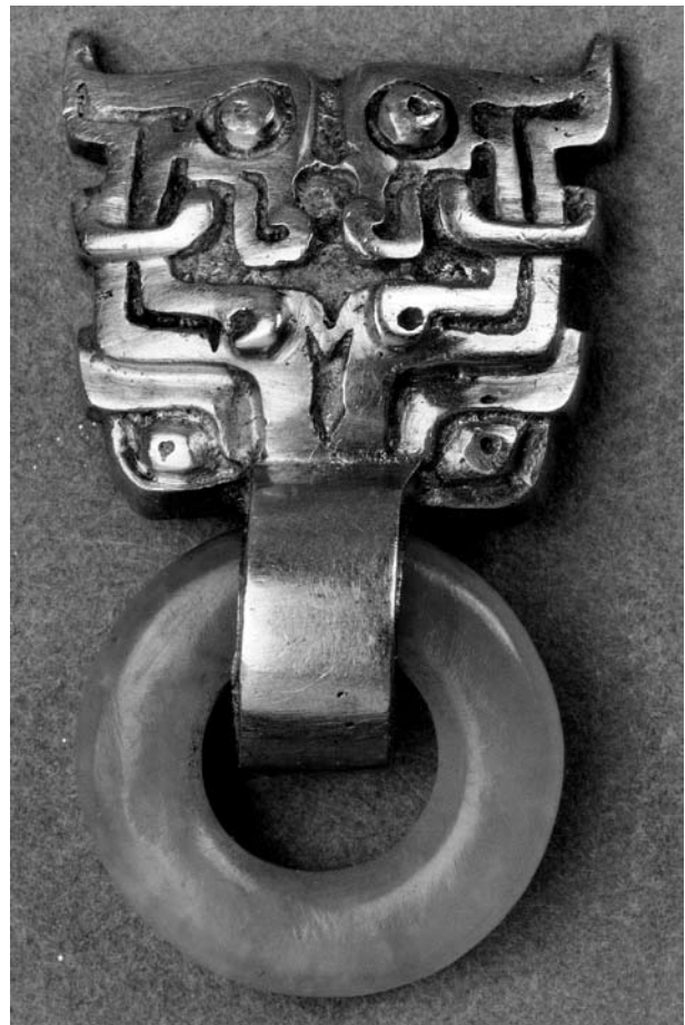
Dörrkläpp i form av ett djurbuvud i guld med ring av jade i munnen. Den är bara 2,8 cm lång och bör ha varit en gravgåva.

Både guld och silver användes som inläggning på föremål av andra material. De berömda bronshästetkipagen,