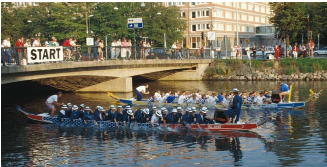
Bilder från Malmöfestivalens drakbåtstävlingar tagna av Bertil Lundahl (s.16) och Ingvar Mauritzson (s.17).