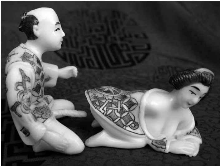
Den här typen av sexfigurer kan man ibland hitta på marknader.

bordeller som betalade skatt till Nationalistpartiet i utbyte mot licens. De prostituerade indelades i fyra klasser och deras namn fanns på de röda lyktor som hängde utanför bordellerna. De som inte hörde till en bordell utan gick på gatan hade lägst status och kallades för ”fasaner” (vildhöns).