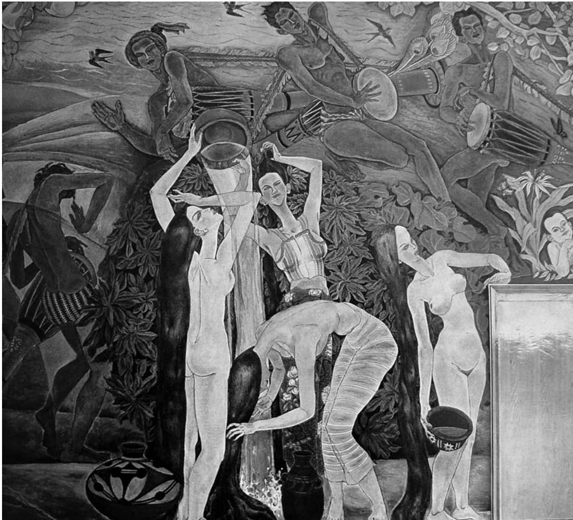
Den nya flygplatsterminal i Peking som invigdes 1980 utsmyckades med ett antal väggmålningar. Denna målning av nakna kvinnor blev dock för kontroversiell och doldes ganska snart. Motivet är daifolkets "stänka-vatten-festival". Det är ingen tillfällighet att motivet är kvinnor från ett minoritetsfolk och inte från majoriteten bankineserna.

olika kvinnor skulle han dessutom tillgodogöra sig deras yinnessens, vilket gav honom mer energi. När han stärkt sig tillräckligt skulle han släppa sin säd i sin förstahustru på en dag då hon sannolikt var fertil och på så sätt få en kraftfull avkomma.