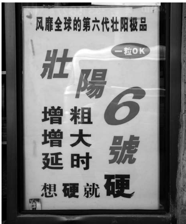
På denna skylt i en sexbutik i Peking från 2004 gör man reklam för piller som ska stärka mannens yang. Vad som ska "Öka i grovlek, öka i storlek och dra ut på tiden" kan man ana. Lite positivt tänkande "tänka hård, så (blir den) hård" finns också med.