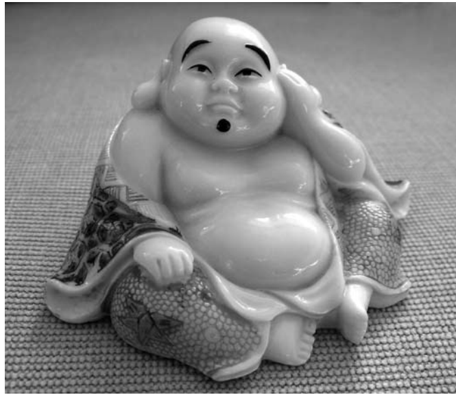
Under denna buddhafigur döljer sig en överraskning.