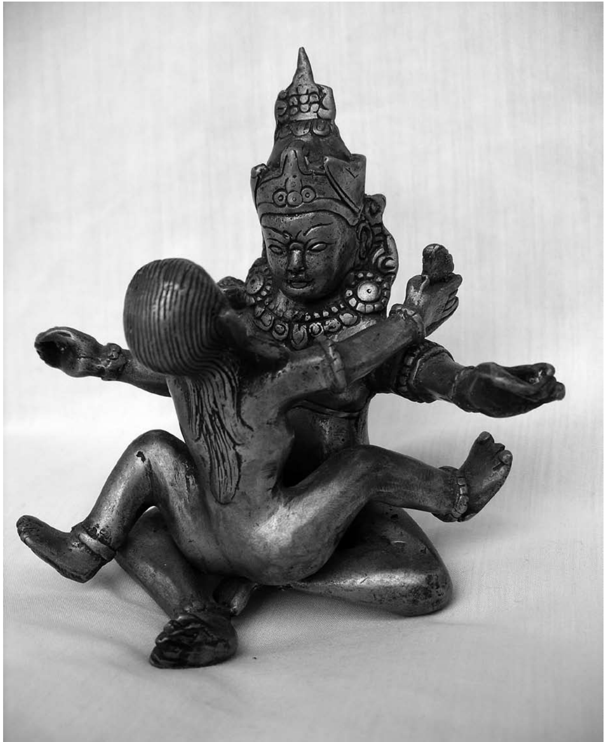
Statyer med motivet "bänförd" Buddha (Huanxi Fo) förekommer i lamaismen och har tolkats på olika sätt. I lamatemplet Yonghe gong i Peking har man av anständighetskäl täckt över den kvinnliga figuren.