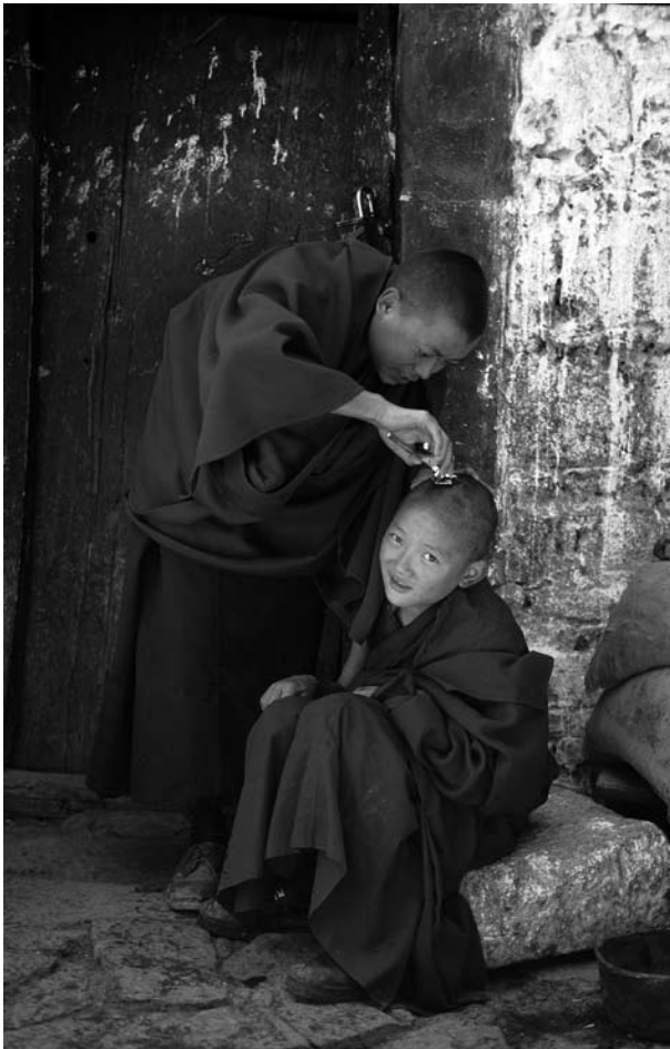
En ung pojkmunk klipper en annan, Ramoche-templet, Lhasa

siska, har goda förbindelser med ekonomiska och politiska centra i östra Kina och trivs i kinesisk arbetskultur.