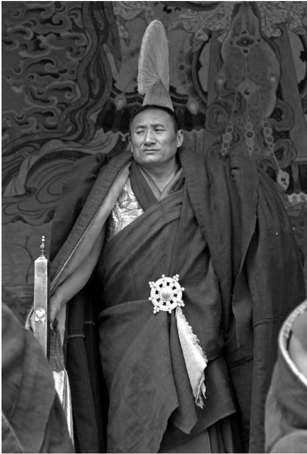
Labrangklostrets "shengo", eller "chefsmonk" står och blickar ut över munkarna på en tempelgård i staden Xiabe i Gansu-provinsen. Labrang är det största tibetanska klostret utanför Tibet TAR och ligger vid den östliga gränsen av den tibetanska kulturvärlden. En Shengo innebar klostrets nästhögsta position efter abboten. Han är den som ser till att disciplin råder bland munkarna och i klostret. I högra handen håller han en stor och tung silverstav som han går omkring och dunkar i marken med för att signalera disciplin och skärpning. En shengo är ofta skräckinjagande och bär barsk min. Det är kraftiga, stora män som bär uppstoppade kläder så att de ser större ut än vad de är.

Förutom tvisten om Panchen Lama och inskränkningarna i religionsfriheten är förstas det återkommande okvädandet och fördömandet av Dalai Lama något som väcker tibetanernas antipati mot kineserna. Vid flera olika tillfällen under senare år har tibetanerna på olika sätt visat att för dem är Dalai Lama deras verkliga ledare, vilket väl KKP också börjat inse. Det förefaller