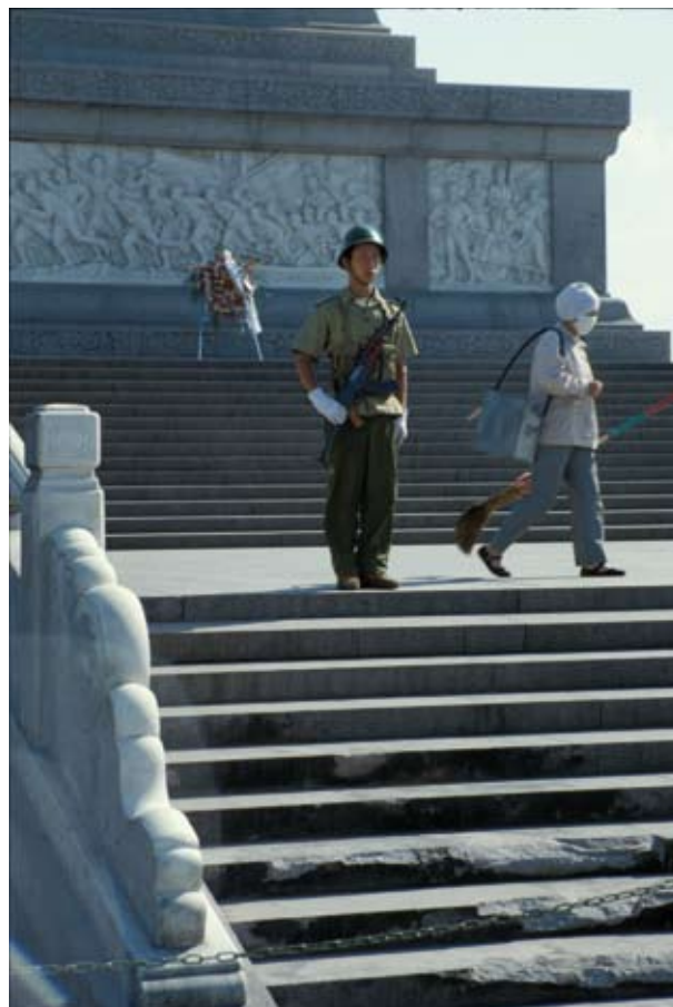
En soldat vaktar Monumentet över folkets hjältar på Himmelska fridens torg i september 1989. Spåren efter militärens framsart syn ännu på trappstegen.

Deng gav klartecken för ekonomiska reformer men