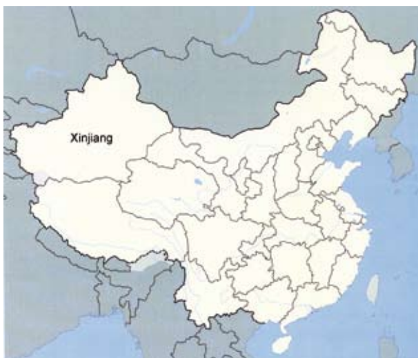
Wikipedia-karta som visar Xinjiangs läge i Kina.

Oasstäderna runt Tarimbäckenet, framför allt de längst