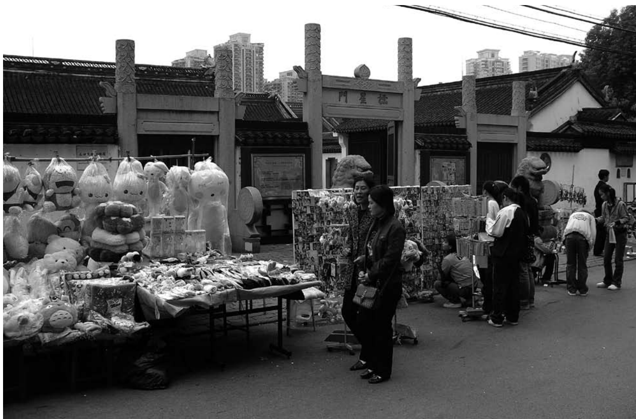
Utanför Konfucius templet i Shanghai säljer man bl.a. den här typen av nallar. Inne på tempelområdet var det färre människor än på bilden.

För kommunisterna var religionen ett opium för folket – något som man räknade med skulle dö ut efterhand som det socialistiska systemet visade sin överlägsenhet. Man bedrev kampanjer mot den och sådant som sågs som