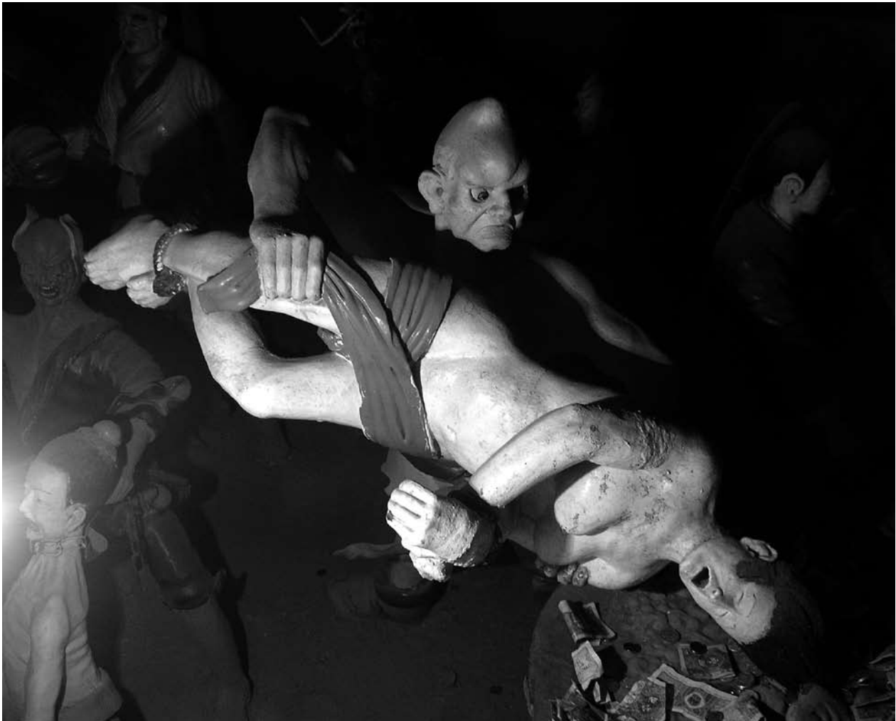
Templet i "Spökstaden" Fengdu visar de fjasor man kan råka ut för efter döden om man inte levt som man bör.

resignerade inför sitt öde och inte gjorde uppror.