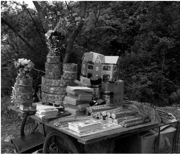
Rökelse, smållare och pappersbus (i västerländsk stil) till försäljning i samband med Qingming-högtiden. Seden att bränna pappersmodeller av bus, bilar, tv-apparater m.m. till förfäderna förekommer nu inte bara bland kineser utomlands utan även i Kina.