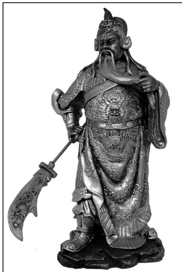
Guan Yu, en general från De tre kungadömenas tid, är ett exempel på en historisk person som blivit en nationell gudomlighet.

Ett annat särdrag i den kinesiska guda- och tempelvärlden var blandningen av gudar i ett och samma tempel. Det berömda Hängande templet i Shanxiprovinsen har statyer av såväl Buddha som den daoistiske anfadern Lao Zi och av Konfucius. Sådana tre-lärors-tempel fanns även på andra ställen. Dock uppskattade inte konfucianer att statyn av Buddha placerats på den centrala (viktigaste) platsen och att även Lao Zi placerats högre i rang än Konfucius.