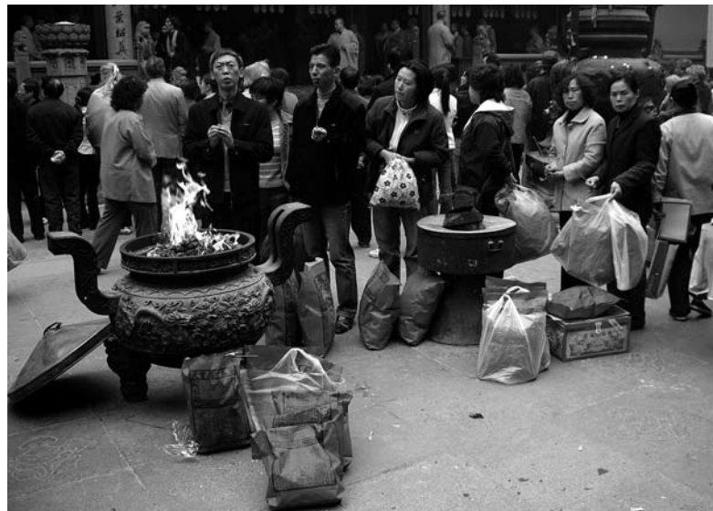
Shanghaibor köar i Jadebuddhatemplet för att bränna symboliska pengar i form av pappers-tackor till sina förfäder vid Qingming-högtiden (Gravvårdshögtiden).

Konfucianismen var inte primärt en religion utan främst en filosofi inriktad på det liv vi lever här på jorden. Den handlar om hur man ska handla moraliskt gott och skapa ett fungerande samhälle. Men det fanns hos de flesta konfucianer, liksom hos Konfucius själv, en föreställning om att Himmelen som en högsta makt stödde en god moralisk ordning i samhället.