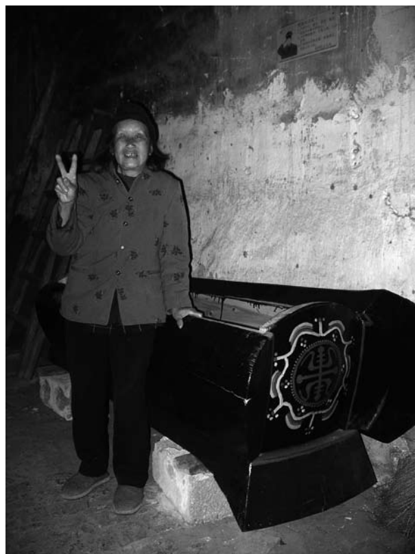
Samma kvinna gör V-tecknet vid sin keista, som står färdig i hemmet. Hon har uppenbarligen ett avspänt förhållande till döden.