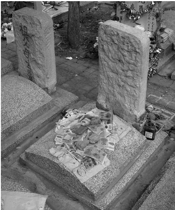
Vid Qingming-högtiden besöker man förfädernas gravar och ställer fram olika offergåvor. Här ses t.ex. de speciella pengar man lägger ut eller bränner till de döda och en flaska av Pekings folkebrännvin Erguotou. Eftersom gåvorna speglar vad den döde tyckte om är det ganska vanligt att man ser brännvinsflaskor eller cigaretter vid gravarna.

För konfucianer var det statsmaktens representanter, ämbetsmännen, som skulle fostra folket till goda medborgare. Dessa ämbetsmän, som hade Konfucius som förebild, visade sin vördnad för honom i de Konfuciestempel som byggdes runt om i landet. Där kunde de också söka stöd inför examina, som för många var avgörande för en karriär som ämbetsmän. Även kejsare kom ibland till Konfuciestempel för att offra till denna symbol för visheten.