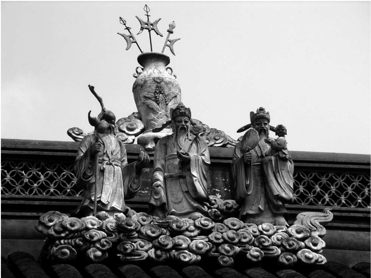
På Stadsgudens tempel i Shanghai kan man se dessa mycket vanligt förekommande gudomligheter som representerar fr.v. långt liv (Shou), hög ställning och goda inkomster (Lü) samt tur-lycka (Fu).

Templerna var inte bara viktiga som religiösa kultplatser. Vid tempelmarknaderna samlades stora skaror av människor för att göra affärer, spela om pengar, se på teater, akrobatik och magiker, eller lyssna till historieberättare. Man kunde också konsultera spåmän för att höra om ens framtida öde. Människor sökte, precis som i orakelbensinskriftionerna, vägledning från högre makter när det gällde hur, när och var något skulle göras. Den traditionella almanackan spelade en viktig roll för vägledning om när saker skulle göras eller undvikas för att lyckan skulle stå en bi. Ifråga om var man skulle bygga sitt hus eller anlägga en grav fanns det möjlighet att söka hjälp av en geomantiker (specialist på fengshui), som med hjälp av bl.a. hexagrammen i Förvandlingarnas bok, Yin och Yang och de fem elementen kunde hjälpa till att välja lämplig plats för att undvika olyckor.