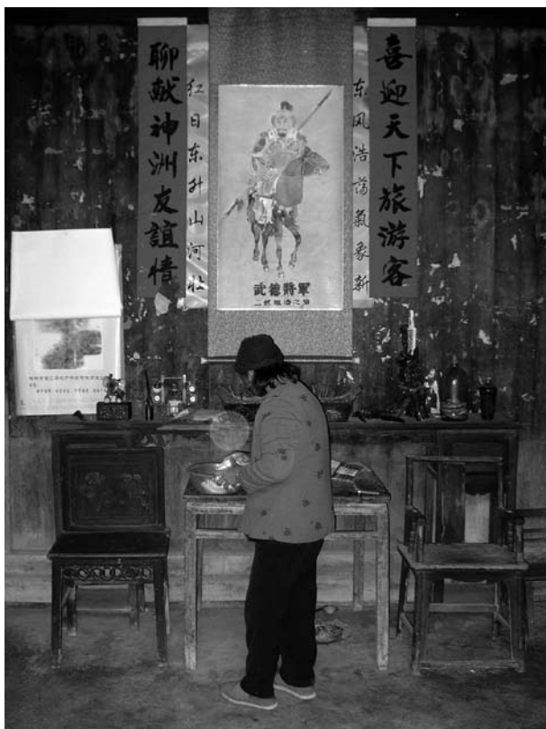
Bondkvinna ordnar med förfädersaltaret i sitt hem. Släktens stoltbet, en general från Qingdynastin, syns på bilden i mitten.