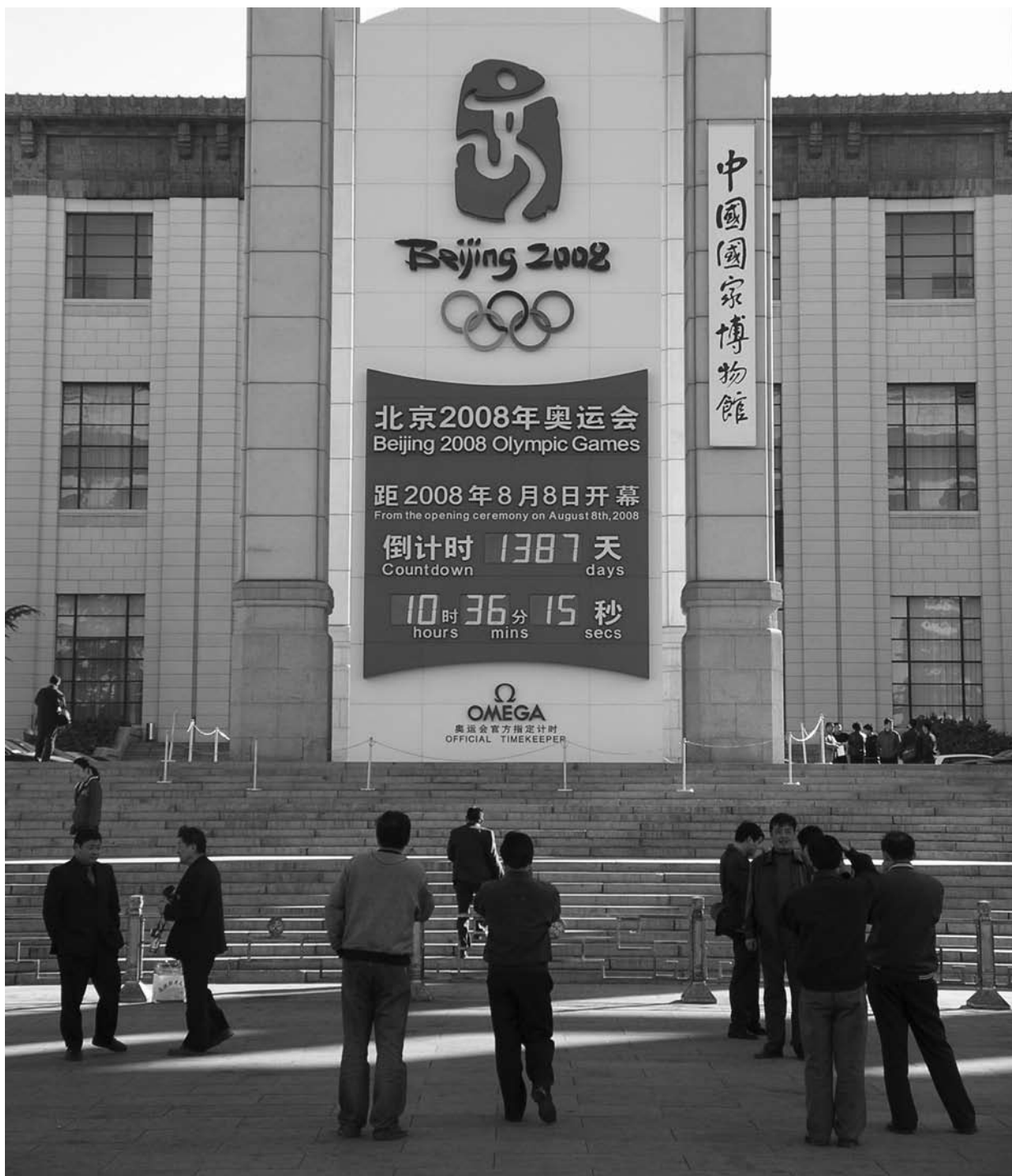
I samband med nationaldagen den 1 oktober avtäcktes den stora tavla som visar hur många dagar, timmar, minuter och sekunder det är kvar till OS i Peking 2008. Den är placerad framför Historiska museet vid Himmelska fridens torg.