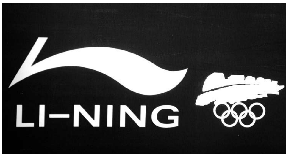
Gymnasten Li Ning har efter karriären skapat det största företaget för sportkläder i Kina.

En lite sökt kombination, för man får väl utgå från att det inte var brännvin som gjorde henne till världsstjärna.