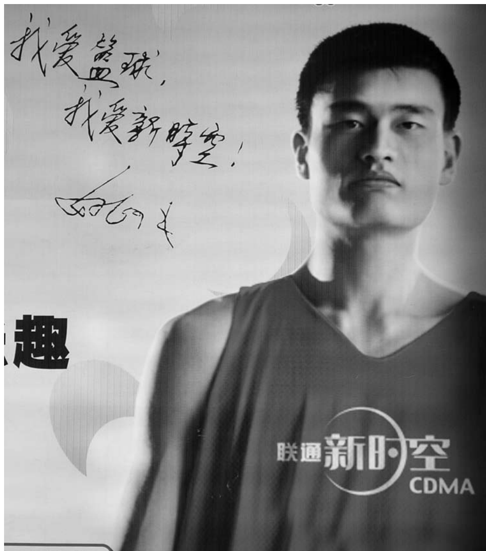
Den 226 cm långa basketbollspelaren Yao Ming, som här gör reklam för teleoperatören China Unicom, bar den kinesiska flaggan under inmarschen vid OS i Athen.

grenarna gång och långdistanslöpning för damer som man tagit några enstaka OS-guld. I dessa uthållighetssporter har asiater haft lättare att hävda sig. Den stora överraskningen i Athen var att en kines tog guld på 110 m häck för herrar, en gren som oftast dominerats av svarta löpare. Segraren Liu Xiang var alldeles omtumlad och verkade knappt fatta vad han ställt till med när han intervjuades av kinesisk TV efter loppet. Inte nog med att han hade vunnit, han hade dessutom vunnit överlägset och tangerat världrekordet.